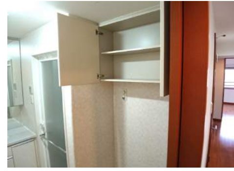
◆洗濯機スペースの上にも収納が