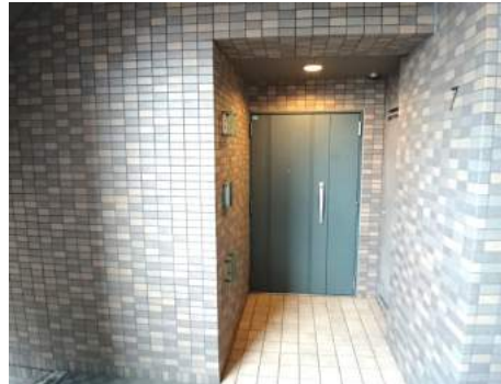
◆奥行きのある玄関スペース