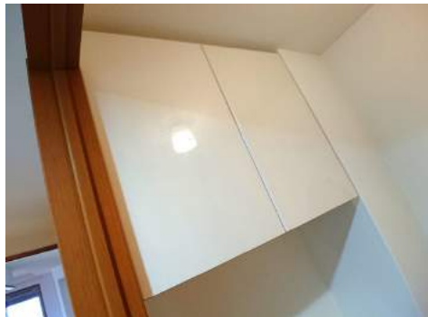
◆トイレ上部にもしっかりと収納スペースが