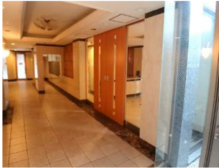
◆潇洒な雰囲気を出し出すエントランスでお客様をお出迎え