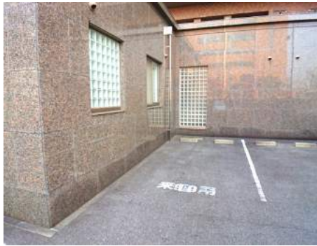
◆来客用駐車場2台分完備