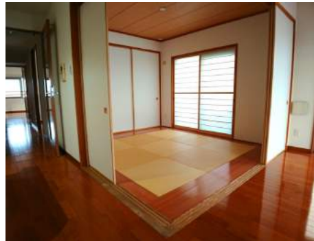
◆リビングと繋がる和室は襖を閉じてプライベートな空間としても使えます