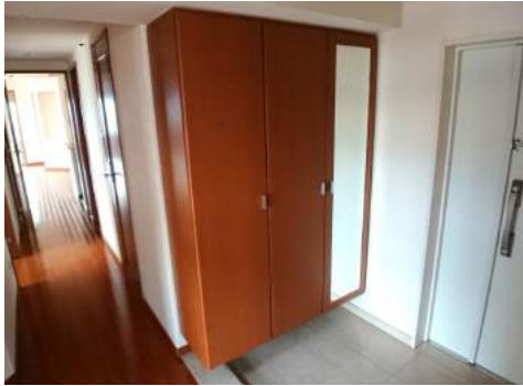
◆天井まである大型シューズボックス