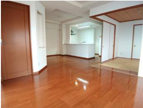
◆18.6帖のLDKは6帖の和室と一体で使えば更に広々