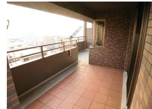
◆リビング前のスカイテラス南側の開放的な眺望を独り占め