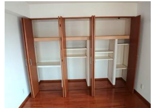
◆10帖洋室のクローゼット ◆収納スペースの多さは100㎡マンションならではの