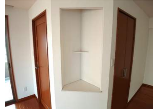
◆小物が飾れるニッチスペース