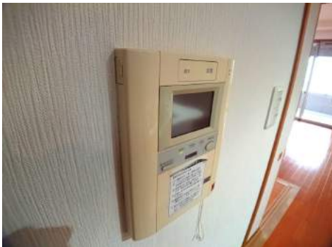
◆TVモニター付インターホン ◆セキュリティ機能も完備