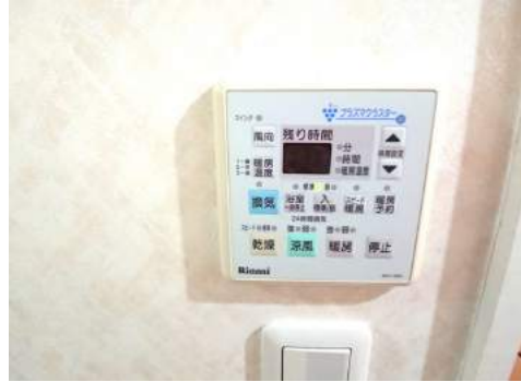
◆雨の日の洗濯も安心。浴室暖房乾燥機完備 ◆タイマー付きです