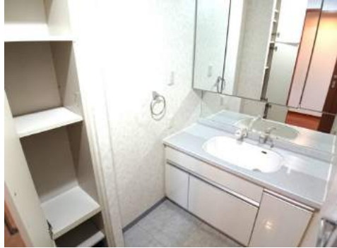
◆シャンプードレッサー付大型洗面化粧台 ◆収納スペースもしっかりあってタオルも沢山置けます