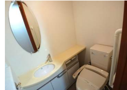
◆暖房洗浄機能付の多機能トイレ ◆ミラー&小物が置ける手洗いカウンター