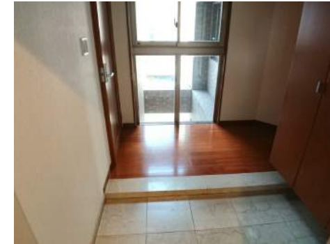
◆玄関を入ると目の前には外部吹抜け