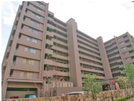
◆全89戸◆10階建の7階、東南角部屋です