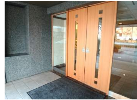
◆玄関は勿論オートロック◆宅配ボックス完備