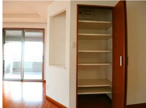
◆あると便利！！ リビング収納