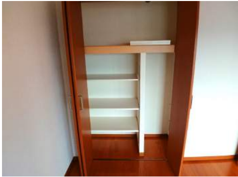
◆6帖洋室の収納◆可動棚でスペースを組み換えできます