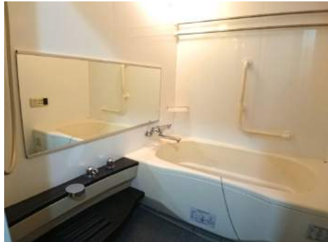
◆奥行きが広いシステムバス ◆ゆったりとしたバスタイムを満喫