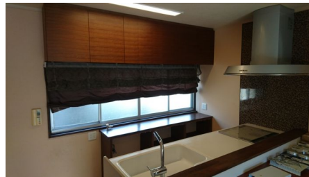
IHクッキングヒーターを備えたシステムキッチン。