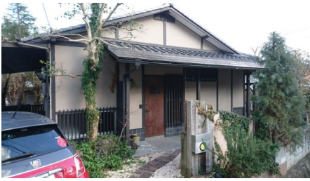
落ち着いた佇まいの平屋一戸建