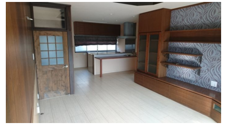
ローボードを備えた16.5帖のLDK。