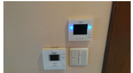
太陽光発電で電気代も節約できます。モニター付インターホンも完備。